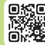
新型コロナワクチンに関する情報収集方法(薬剤部)