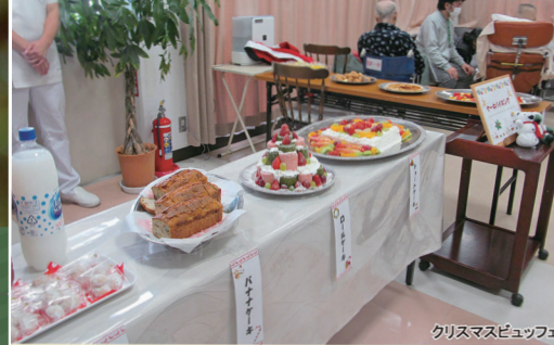
クリスマスビュッフェ