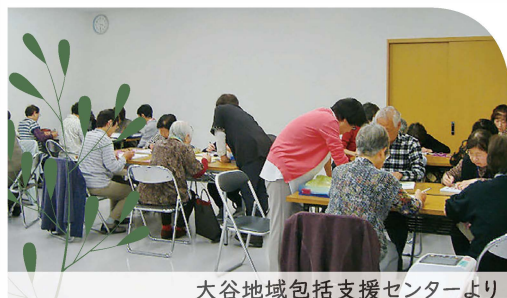
大谷地域包括支援センターより